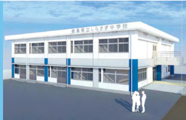
しらさぎ中学校イメージ図

学びへの前向きな気持ちに応える「全国初の県立の夜間中学」です。 令和2年9月1日から入学の受付を開始します。